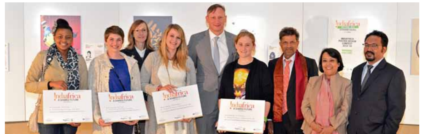
INDIAFRICA Poster Design Contest Winners from FADA, Johannesburg