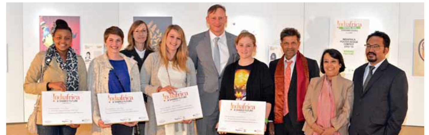
INDIAFRICA Poster Design Contest Winners from FADA, Johannesburg