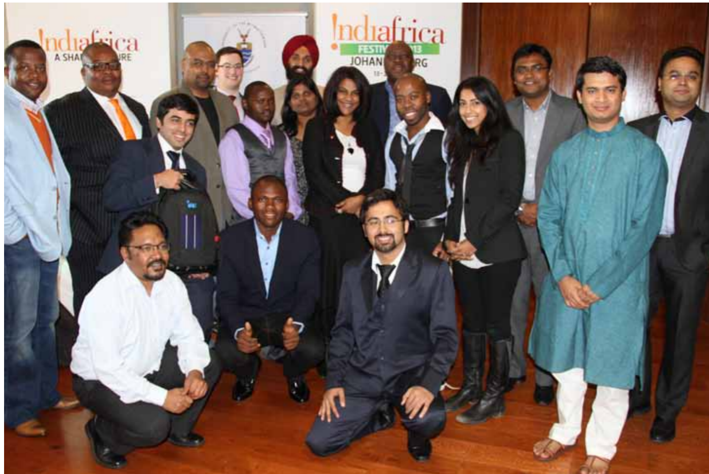
Winners of the INDIAFRICA Business Venture Competition 2012-13 with jury members and organisers